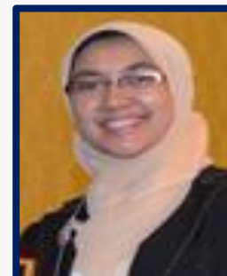
Zuni Barokah Anggota